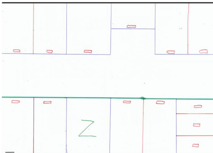
Szkic 1. Kuchnia

Szafka stojąca zamykana (2szt) przeznaczona pod zlew lub płytę grzewczą, stojąca na nóżkach o regulowanej wysokości. Meble w kolorze białym. Uchwyty meblowe w kolorze srebrnym lub zblizonym. Mebel atestowany, powinien posiadać atest zgodności wyrobu z badań wytrzymałościowych, wymogów bezpieczeństwa dotyczący zgodności produktu z normami: PN-EN 14749:2016-04 lub równoważne, atest higieniczny wg PZH na mebel lub równoważne.